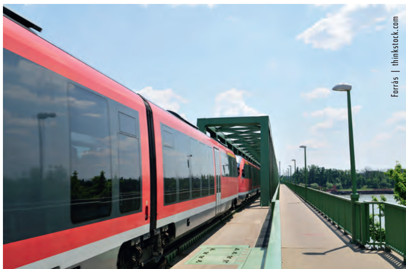
Forrás | thinkstock.com

Forrás: Portfolio.hu, Index.hu, Nif.hu, MTI