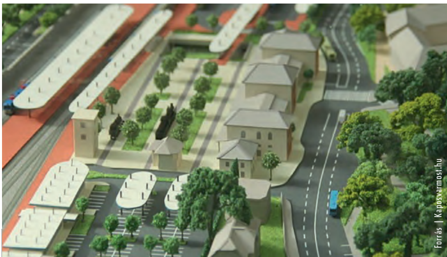
Forrás | Kaposvármest.hu